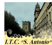
I.T.C. "S. Antonio"