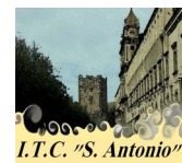
I.T.C. "S. Antonio"

tutela della riservatezza e dell'integrità dei dati non solo nella fase di conservazione ma anche durante le fasi di trattamento.